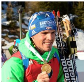
Simon Schempp Ehemaliger deutscher Biathlet

Württemberg, Deutschland - Die Peak Performer Stiftung freut sich, das erste Mal in Kooperation mit der Schüssler Escher Stiftung in Württemberg (Uhingen) zu Gast zu sein. Das 11. Peak Performer Kids Camp findet am 19. und 20. Oktober 2024 statt und steht ganz unter dem Motto: Spiel, Spaß und echte Vorbilder. Unter der Schirmherrschaft von Biathlon-Legende Magdalena Neuner befähigen Spitzensportler und Top-Unternehmer Kinder spielerisch, aus eigener Kraft etwas zu erreichen.